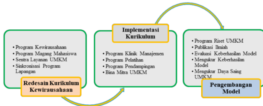
Gambar 2: Peran Perguruan Tinggi Dalam Pengembangan Pengelolaan UMKM

Dalam rekonstruksi model menunjukkan bahwa untuk membangun daya saing UMKM diperlukan tiga tahapan dimana tahapan satu dengan tahapan berikutnya merupakan bagian yang tidak terpisah, oleh karena itu program harus dirancang secara ter-integrated agar optimalisasi peran perguruan tinggi benar benar memberi kontribusi riil dalam memperkuat daya saing UMKM. Implementasi kurikulum merupakan tahapan yang sangat krusial karena pada tahap ini memerlukan sumber daya lembaga perguruan tinggi yang sangat besar, baik untuk biaya operasional, biaya tenaga kerja, prasarana penunjang, monitoring dan evaluasi kegiatan sentra layanan manajemen kepada pelaku UMKM. Demikian juga pengembangan model meliputi aspek yang tidak mudah karena menyangkut kompetensi peneliti serta sumber pendanaan untuk operasionalnya.