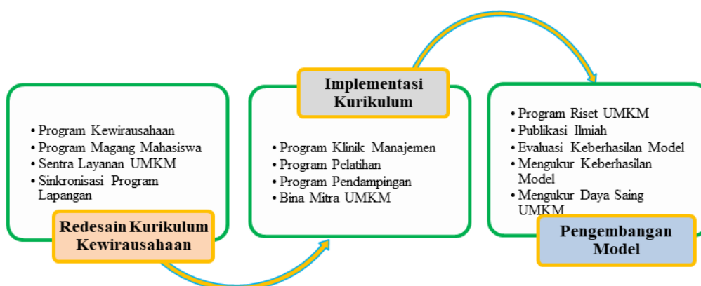
Gambar 2: Peran Perguruan Tinggi Dalam Pengembangan Pengelolaan UMKM

Dalam rekonstruksi model menunjukkan bahwa untuk membangun daya saing UMKM diperlukan tiga tahapan dimana tahapan satu dengan tahapan berikutnya merupakan bagian yang tidak terpisah, oleh karena itu program harus dirancang secara ter-integrated agar optimalisasi peran perguruan tinggi benar benar memberi kontribusi riil dalam memperkuat daya saing UMKM. Implementasi kurikulum merupakan tahapan yang sangat krusial karena pada tahap ini memerlukan sumber daya lembaga perguruan tinggi yang sangat besar, baik untuk biaya operasional, biaya tenaga kerja, prasarana penunjang, monitoring dan evaluasi kegiatan sentra layanan manajemen kepada pelaku UMKM. Demikian juga pengembangan model meliputi aspek yang tidak mudah karena menyangkut kompetensi peneliti serta sumber pendanaan untuk operasionalnya.