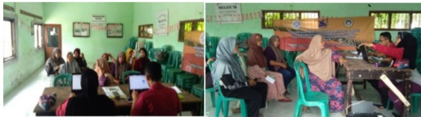
Sumber: Jum'ati, 2018

Tahapan berikutnya pemberdayaan sosial ekonomi bagi keluarga peserta KB vasektomi Siwalan Mesra yaitu pendampingan pengurusan SIUP (Surat Ijin Usaha Perdagangan). Pendampingan tersebut dimulai dengan mengumpulkan data identitas diri dan data keluarga bagi wirausahawan yang berdomisili di kota Surabaya.