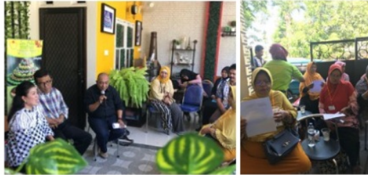
Sumber: Jum'ati, 2018

Dalam hal pengelolaan sumber daya manusia tidak terlepas dari pola operasional. Pengembangan Sumber Daya Manusia dilakukan secara bertahap dengan memilah dan memilih pekerjaan. Dalam hal ini pemisahan pekerjaan dilakukan ( job description atau task list ) dan disusun pola kerja secara operasional, di mana ada pekerjaan yang dapat dilakukan secara bersama-sama dan ada pekerjaan berbeda yang dilakukan bersamaan waktunya. Ada pula pekerjaan yang dilakukan dengan tahapan demi tahapan sehingga pekerjaan yang satu menunggu atau ada persyaratan bahwa pekerjaan sebelumnya harus sudah selesai.