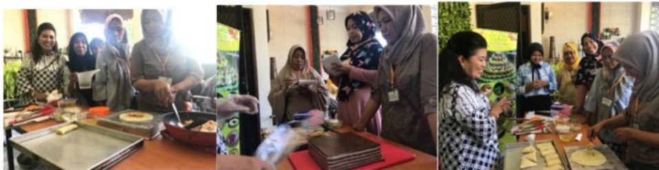
Sumber: Jum'ati, 2018

Tahapan berikutnya adalah pelatihan praktek pembuatan produk makanan dari Lien Cakes dengan standar. Peran serta aktif para peserta pada proses pelatihan seperti pada gambar 11, di mana standar produk antara lain adalah resep, alat ukur dalam pembuatan (misal: gelas ukur, timbangan dan lain-lain), waktu dalam proses pembuatan dan ukuran produk jadi yang terstandar (misal: pengirisan, alat cetak dan lain-lain).