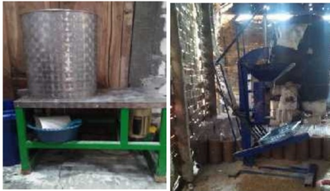
Gambar 5.5 TTG Mesin Peniris Minyak dan Mesin Press Log Jamur

Pelatihan ini ditujukan agar mitra mampu mengoperasikan alat yang diberikan agar aman dan hemat biaya, mulai dari pemahaman tentang TTG, cara pengoperasian, prosedur keamanan, menghitung biaya alat/produksi, dan penyusutan mesin.