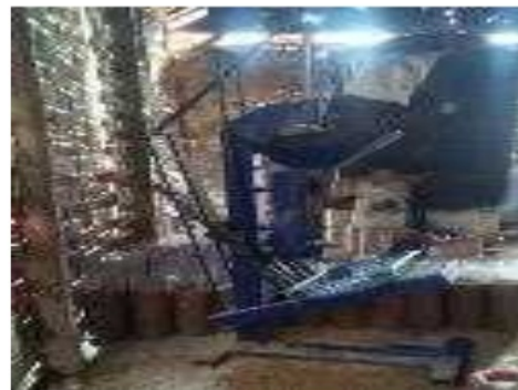
Gambar 5.1 Perbaikan rumah jamur dan TTG Mesin Press Log