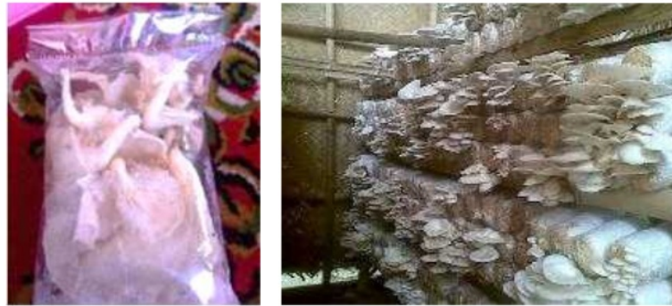
Gambar 1.3 Jamur Tiram yang siap panen dan kemasan yang siap jual

Dari wawancara yang dilakukan dengan pemilik Mitra, selama ini Mitra belum pernah melakukan pencatatan keuangan, baik pemasukan maupun keluaran, tidak ada perencanaan produksi dan pasca panen. Mitra tidak pernah membuat laporan harian sehingga tidak diketahui berapa laba/ruginya. Ketika ditanyakan berapa besaran keuntungan perbulannya, Mitra menjawab kira-kira tanpa ada catatan pasti keuntungan yang didapat. Selain itu juga tidak ada catatan produksi dan perencanaan produksi sehingga hasil yang dicapai hanya berdasarkan berapapun jamur yang tumbuh dan siap panen, bukan pada perencanaan yang matang.