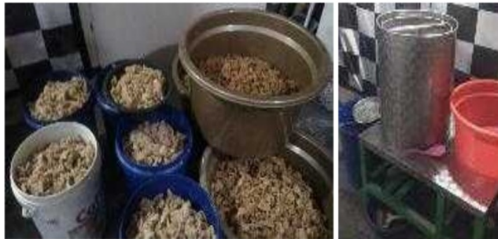
Gambar 5.3 Pelatihan Produksi

dan tahan lama. Dalam perkembangannya produksi ditingkatkan dengan mengolah keripik jamur menjadi beberapa variasi rasa, yaitu: original, balado, ayam panggang, barbeque serta jagung manis.