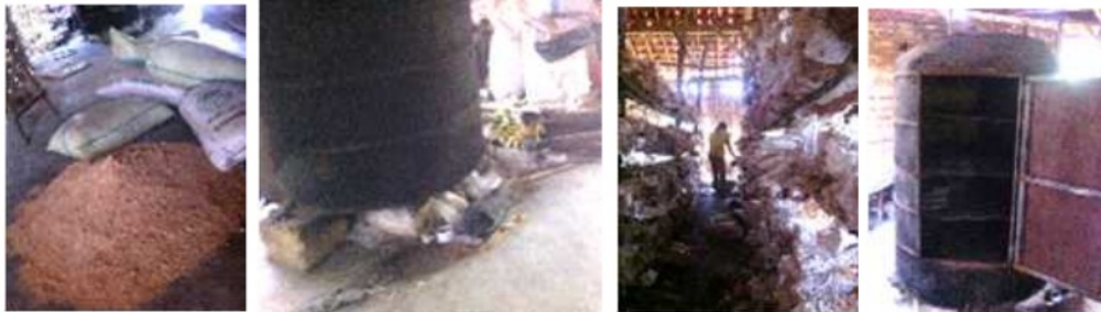
Gambar 1.2 Proses Produksi jamur

memadatkan baglog, sehingga tingkat kepadatan baglog tidak sama.