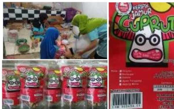
Gambar 5.4 Produk Olahan Keripik Jamur Aneka Rasa dan Kemasannya

baik, dari keamanan untuk pangan, ketebalan dan jenis plastinya serta desain kemasan agar terlihat menarik dan memenuhi standar kemasan pangan yang baik sesuai dengan peraturan yang ditetapkan oleh Dinas Kesehatan/Dinas Penanaman Modal PTSP.