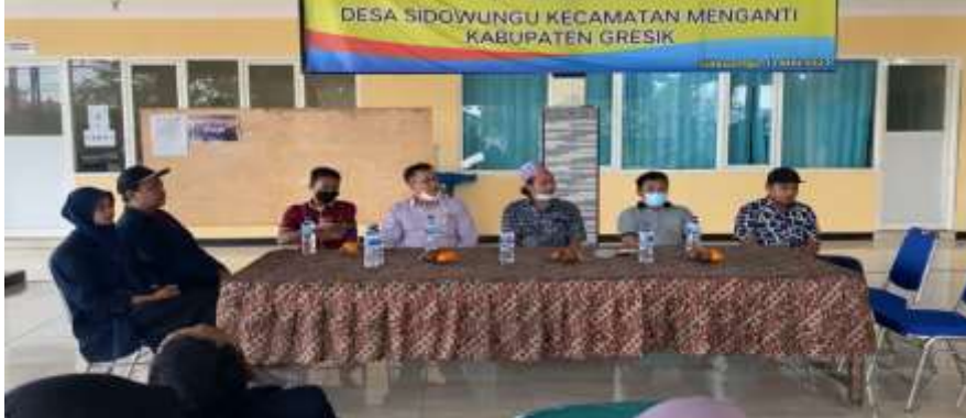
Gambar 1. Kerjasama dengan Kepala Desa Sidowungu Kecamatan Menganti

keripik usus di dapat secara otodidak. Selama kurang lebih 2 tahun dampak pandemi covid 19 beliau mampu bertahan menghadapi krisis walaupun penjualan mengalami penurunan. Beliau menitipkan keripik usus pada pedagang - pedagang di sekitar obyek wisata telaga mboro.