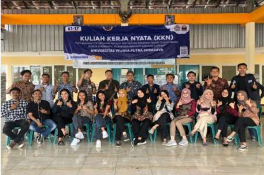
Gambar 4. Sesi foto bersama setelah kegiatan

penjualan dan hubungan masyarakat ( public relation ) ( Madura, 2017 ). Iklan merupakan presentasi penjualan yang bersifat non personal di komunikasikan dalam bentuk media dan non media untuk mempengaruhi sebagian besar pelanggan. Personal selling adalah presentasi penjualan perorangan untuk mempengaruhi satu atau lebih pelanggan. Sedangkan promosi penjualan dapat dilakukan dengan memberikan potongan dan sampel produk. Selanjutnya public relation dapat dilakukan dengan mengadakan acara - acara khusus seperti pameran, konferensi pers atau rilis berita (Madura, 2017 ).