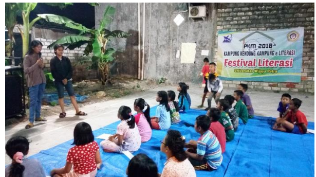
Gambar 1. (Kegiatan Anak Membaca)

Kegiatan bercerita ini dapat dimulai dengan membaca cerita bergambar, mendengar dongeng, ataupun melihat film pendek secara bersama – sama. Kegiatan tersebut bisa dilihat dari foto foto dibawah ini: