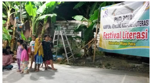
Gambar 2. (Kegiatan Anak Membaca)

Setelah membaca cerita pendek bergambar anak-anakpun menceritakan kembali apa yang sudah mereka baca