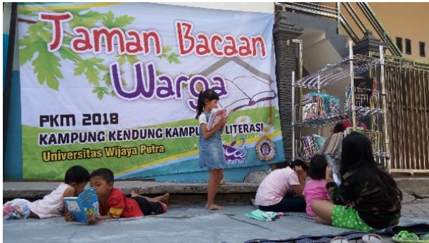
Gambar 4. (Kegiatan Menceritakan Ringkasan Cerita Dari Buku Yang Telah Dibaca)

Gambar 3. (Kegiatan mendengar cerita lisan atau dongeng sebagai bahan untuk bercerita kembali)