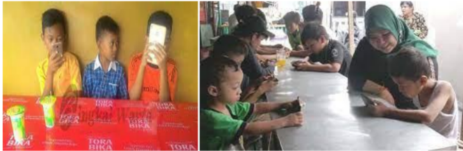
Gambar 1. Penggunaan gadget/teknologi pada anak

Berdasarkan latarbelakang tersebut, maka tim mengidentifikasi spesifik aspek – aspek permasalahan mitra sebagai berikut: