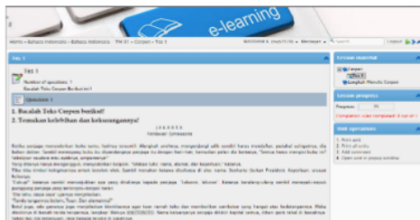
Gambar 5. Tampilan Menu Tugas

Siswa dapat bertanya mengenai materi pelajaran kepada guru melalui menu