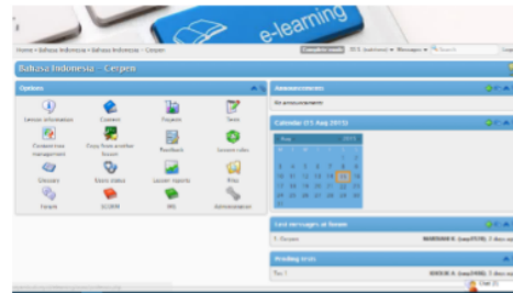
Gambar 2. Tampilan Menu Guru

materi dan soal pada aplikasi Efront dengan login terlebih dahulu menggunakan hak akses guru yang terdapat pada aplikasi Efront .