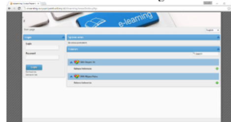
Gambar 1. Menu Login Efront

Komentar yang disampaikan oleh ahli media adalah pada prinsipnya desain tentang aplikasi media pembelajaran yang dikembangkan sudah layak digunakan sebagai instrumen penelitian dengan sedikit penyempurnaan. Berdasarkan wawancara mengenai tanggapan model pembelajaran Elearning berbasis Efront ini bahwa aplikasi Efront yang dipergunakan untuk pembelajaran Elearning sudah sesuai dan menarik untuk tingkat SMA.