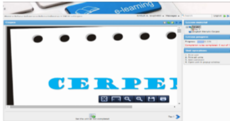
Gambar 4. Tampilan Menu Materi