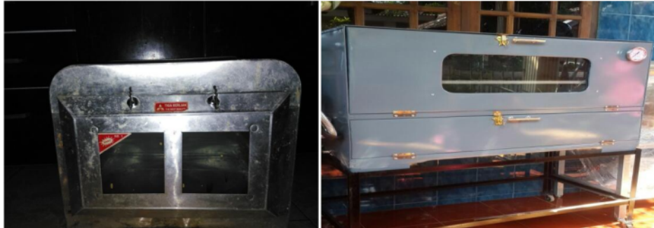
Gambar 5.8. Oven sebelum dan sesudah bantuan

Produksi dan omset yang diperoleh kelompok mitra 1 sebelum dan sesudah adanya program Iptek bagi Masyarakat (IBM) ini adalah sebagai berikut: