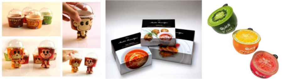
Gambar 2.3 : Contoh Packaging minuman dan makanan yang menarik