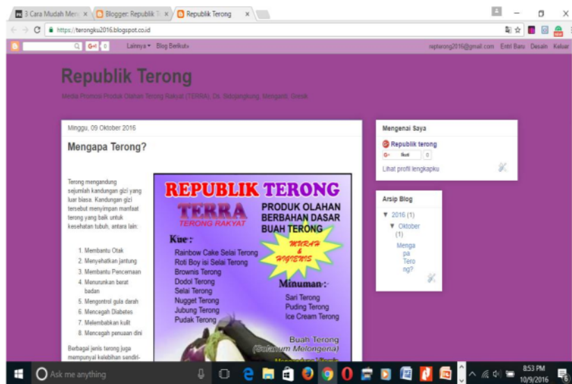
Gambar 5.4. Blog Republik Terong

Selanjutnya untuk meningkatkan omset penjualan dan target market, Tim IbM juga memberikan bantuan sarana pemasaran berupa Blog sehingga produk olahan terong dari Desa Sidojangkung semakin dikenal masyarakat luas.