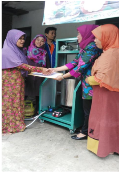
Gambar 5.6. penyerahan bantuan Mesin pengaduk dodol kepada mitra 2

maka sekarang dapat membuat dengan kapasitas 3-4 kg sekali olahan. Dengan demikian proses produksi menjadi lebih cepat dan efisien. Berikut adalah gambar serih terima bantuan pengaduk dodol kepada mitra 2: