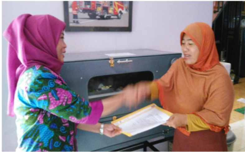
Gambar 5.5. Penyerahan bantuan Oven kepada Mitra 1

Sedangkan pemberian bantuan alat adalah dalam bentuk teknologi tepat guna yang diperlukan untuk meningkatkan proses produksi baik pada mitra 1 maupun mitra 2. Untuk mitra 1 diberikan bantuan peralatan untuk meningkatkan volume produksi yaitu berupa Oven dengan ukuran 0,8 x 1 m sehingga kelompok mitra 1 dalam memproduksi makanan berbahan dasar terong seperti brownis terong, roti boy terong, roll cake terong dapat lebih cepat dengan kapasitas oven yang cukup besar. Selain itu dengan oven berkapasitas besar akan lebih meningkatkan efisiensi dan menekan biaya produksi. Berikut adalah gambar serah terima bantuan oven kepada mitra 1: