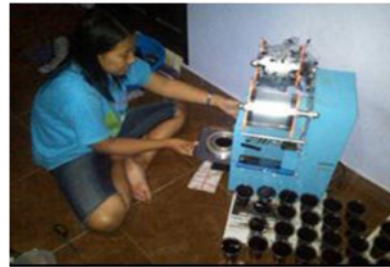
Gambar 1.4. Pengemasan roti dan sari terong yg msh sederhana