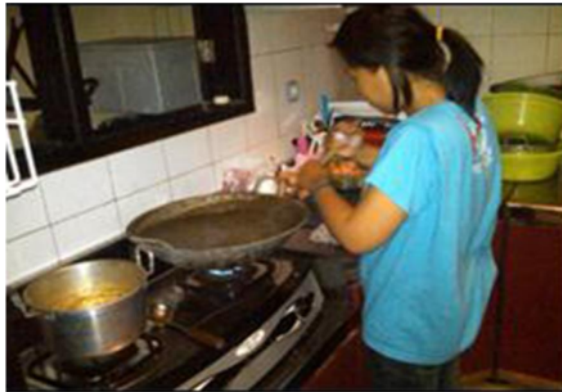
Gambar 5.3. mengaduk dodol secara manual

Selain adanya peningkatan dalam kemasan menjadi lebih menarik, kualitas produk dan rasa dodol yang dihasilkan juga mengalami peningkatan. Dari yang sebelumnya dodol terong masih lembek, kurang kenyal dan dari segi rasa yang kurang nikmat, setelah diberikan masukan dari TIM IBM maka produk dodol terong sekarang menjadi lebih kenyal, komposisi rasa yang 'pas' dan diberikan pemanis serta penyedap rasa dengan menambahkan taburan wijen. Proses peningkatan kualitas dodol terong ini melalui beberapa kali uji coba produksi, dan hasilnya selalu ditingkatkan sampai bias menghasilkan dodol yang 'layak jual'.