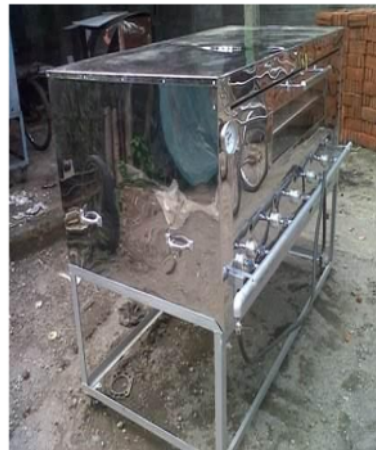
Gambar 2.1: Contoh Mesin mixer dodol dan Oven roti