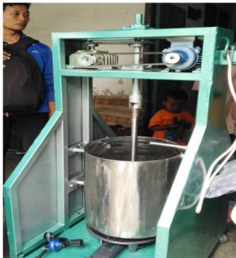
Gambar 5.7. Mesin pengaduk dodol

“ Alhamdulillah dengan adanya bantuan dari ibu dan bapak dari universitas wijaya Putra ini saya bias membuat dodol yang lebih banyak karena kalau dulu saya harus mengaduk dodol dengan tangan jadi saya nggak kuat.....kalau sekarang ada mesin pengaduk ini ya lebih ringan saya dan sekali bikin bisa banyak....kalau harganya dulu saya jual lima ribu sekarang bisa saya jual 8 ribu.....terimakasih ya bu” (wawancara, 25 September 2016).