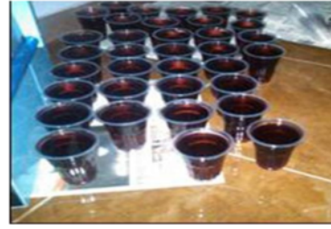
Gambar 1.2. Mencicipi es krim terong Gambar 1.3. Produk sari terong

Adapun anggota kelompok mitra 1 adalah sebagai berikut: