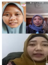
Gambar 2. Aktivitas yang dilakukan dengan media Video Call Group