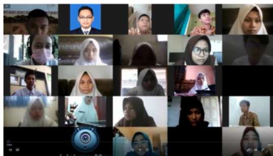
Gambar 1. Pelatihan yang dilakukan dengan media zoom