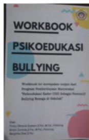
Gambar 5. Workbook Psikoedukasi Bullying

Berdasarkan hasil psikoedukasi yang telah dilakukan diperoleh bahwa beberapa kader OSIS yang terlibat sebagai peserta sebenarnya telah memahami tentang bullying dan dinamikanya namun, pemahaman yang mereka miliki belum detail sehingga turut mempengaruhi awareness yang mereka miliki terhadap kondisi sekitarnya, maka dari itu ketika melihat terjadi tindak bullying beberapa dari mereka ada yang hanya diam saja tetapi ada yang hanya sekedar menegur pelaku. Untuk melihat efektivitas pemberian psikoedukasi proses evaluasi dilakukan berdasarkan Four Level Evaluation Model (Kirkpatrick, 2008) yaitu level