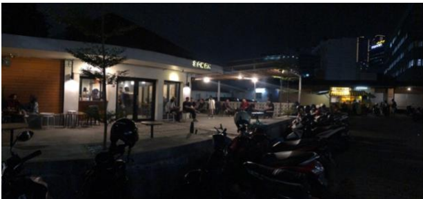
Gambar 1. Kondisi Sowan Coffe I

Lokasi mitra usaha pengabdian masyarakat ini beralamat di Jl. Taman Apsari No 23 Kecamatan Genteng Kota Surabaya. Lokasi tersebut dipilih menjadi pengabdian masyarakat dikarenakan problem empiris dan Coffe Shop yang memiliki lokasi strategis di tengah kota. Hal ini menjadi tantangan tersendiri dimana secara lokasi mitra usaha berada pada tengah kota sementara jumlah pelanggan dan keberlanjutan usaha yang masih kurang maksimal. Hal lain yang menjadi penting untuk dikembangkan adalah potensi penjualan online yang belum maksimal, problem ini menyebabkan mitra usaha sulit untuk mengembangkan perluasan segmentasi pasar. Produk yang diperjualbelikan pada Coffe Shop tersebut umumnya adalah minuman dan beberapa makanan ringan. Coffe Shop Sowan sebetulnya memiliki potensi penjualan yang baik, akan tetapi penjualan pada siang hari sangat minim sehingga memerlukan potensi pengembangan produksi, distribusi dan marketing online lebih lanjut. Selanjutnya akan disajikan beberapa situasi terkini Coffe Shop Sowan lebih detail sebagai berikut: