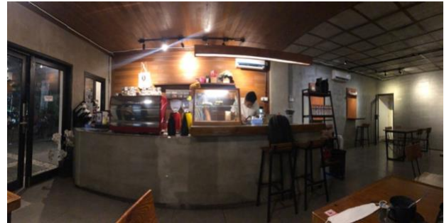
Gambar 2. Kondisi Sowan Coffe II