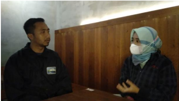
Gambar 4. Kunjungan PPM II

Risk management berkaitan erat dengan manajemen keuangan yang mengusulkan beberapa indikator penting sebagai referensi kebutuhan data pembuatan kebijakan (Baryannis et al., 2019). Era modern peran pembelajaran mesin dan kecerdasan buatan dibahas dalam risk management dan pengelolaan resiko kredit (Glosten & Rauterberg, 2018). Hal ini mengindikasikan bahwa muncul variable baru yang diperhitungkan secara matang sebagai bentuk pengembangan manajemen. Pengabdian masyarakat menggunakan tema tersebut untuk meningkatkan secara aktif literasi dan kemampuan masyarakat dalam menerapkan kaidah-kaidah manajemen dengan baik.