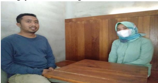
Gambar 5. Kunjungan PPM III

Pelaksanaan pengabdian masyarakat pada kunjungan kedua membahas tentang peningkatan literasi sesuai dengan materi: 1) Pelatihan pengembangan konsistensi produk; 2) Pelatihan penyiapan cadangan stok produk; 3) Pendampingan pengembangan lokasi mitra usaha; 4) Pelatihan strategi promosi marketing online.