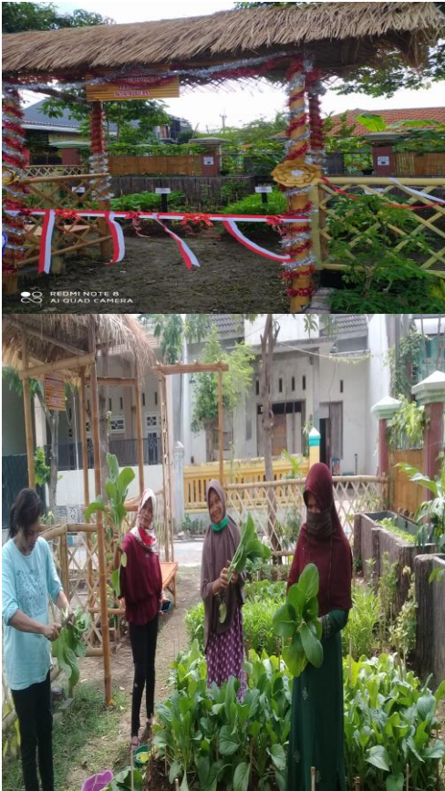
Gambar 2 : Keadaan Lahan Pekarangan (Setelah Program Pengabdian Kepada Masyarakat )

Program kegiatan kepada masyarakat ini berpotensi untuk terus berkembang dan berkelanjutan seiring dengan situasi dan kondisi saat ini. Dalam situasi pandemi seperti ini, masyarakat khususnya ibu-ibu PKK diharapkan dapat meningkatkan ketrampilan dalam mengolah ketahanan pangan dan ekonomi keluarga. Melalui gerakan pemanfaatan lahan pekarangan ibu-ibu PKK RT 03 RW 08 dapat berkreasi di lahan pekarangannya masing-masing dengan berbagai macam varian tanaman yang