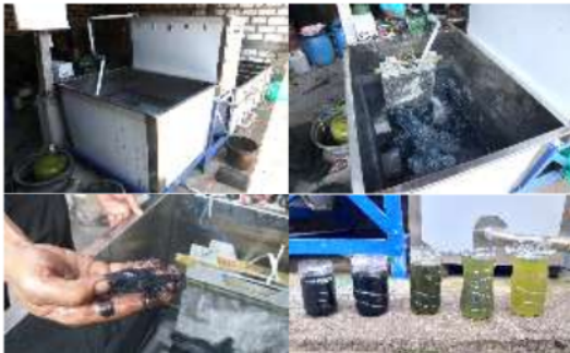
Gambar 4 Uji Operasi

Proses berikutnya setelah proses elektrokoagulasi, air limbah dialirkan ke bak pengendapan untuk diendapkan selama 2 hari, ini berfungsi untuk memisahkan flok dengan air. Dari bak pengendapan ini, air limbah masih berwarna sehingga harus dialirkan ke bak filtrasi yang terdiri dari bak pertama berisi ijuk, bak kedua berisi batu apung dan bak ketiga arang batok kelapa. Dengan mekanisme gravitasi, proses filtrasi ini menghasilkan luaran air yang lebih jernih dan secara visual tidak ada lagi konsentrasi limbah berwarna.