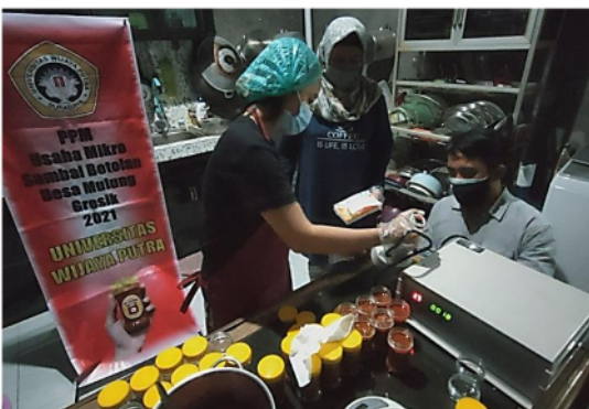
Gambar 2. Mendampingi mitra dalam menggunakan mesin induksi sealer ( induction sealer machine )