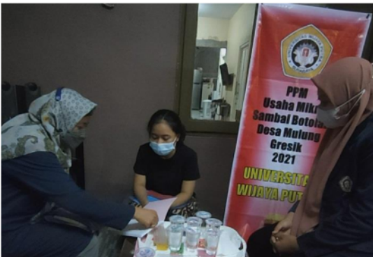
Gambar 3. Pendampingan bidang manajemen keuangan sesi 1