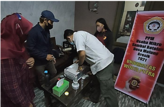
Gambar 1. Pendampingan cara penggunaan dan perawatan mesin induksi sealer ( induction sealer machine )

dari 2 sisi, aluminium foil dan kertas), tutup digulirkan dengan rapat, kemudian handle mesin induksi sealer ( induction sealer machine ) yang memiliki bagian induction port diarahkan pada tutup botol (bagian atas). Proses induksi berjalan kurang lebih 1,6 hingga 1,7 detik dengan cara menekan tombol di handle .