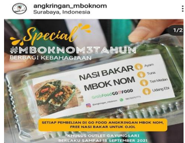
Gambar 6. Nasi Bakar Tuna, Teri Medan, Udang Ebi

Agar dapat memberikan varian makananan yang cock untuk semua kalangan ada penambahan varian baru selain nasi bakar ayam, sate usus, sate telur dan sinom ada nasi bakar (Tuna, teri medan, udang ebi) dan nasi kulit Mbok Nom.