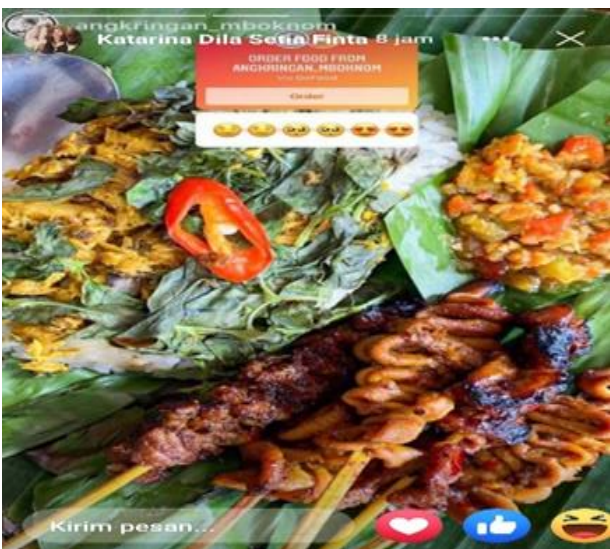
Gambar 5. Kualitas Produk Makanan Tradisional

Agar dapat memberikan varian makananan yang cock untuk semua kalangan ada penambahan varian baru selain nasi bakar ayam, sate usus, sate telur dan sinom ada nasi bakar (Tuna, teri medan, udang ebi) dan nasi kulit Mbok Nom.