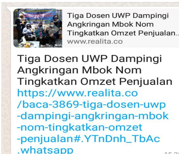
Gambar 17. Publikasi pada Media Online