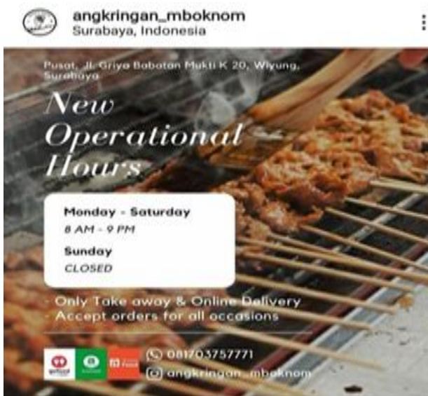
Gambar 12. Penawaran dengan Cara Memberikan Promo-Promo Melalui Medsos

Untuk kemudahan pembayaran di Angkringan Mbok Nom ditambahkan dengan pembayaran melalui CHRIS. Untuk kelancaran prosesnya terlebih dahulu dilakukan sosialisasi CHRIS sebagai alat pembayaran melalui barkode bila pembeli tidak membawa uang tunai.