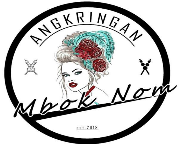
Gambar 3. Logo/Brand

Dari uraian analisis situasi mitra yang ada maka PPM ini merumuskan masalah, yakni: 1) Bagaimana cara menaikkan omset penjualan?, 2) Bagaimana cara memasarkan lebih luas lagi?, 3) Bagaimana cara mengatur keuangannya?, 4) Bagaimana barang dagangannya lebih diminati banyak orang tidak hanya kalangan menengah tetapi kalangan atas?