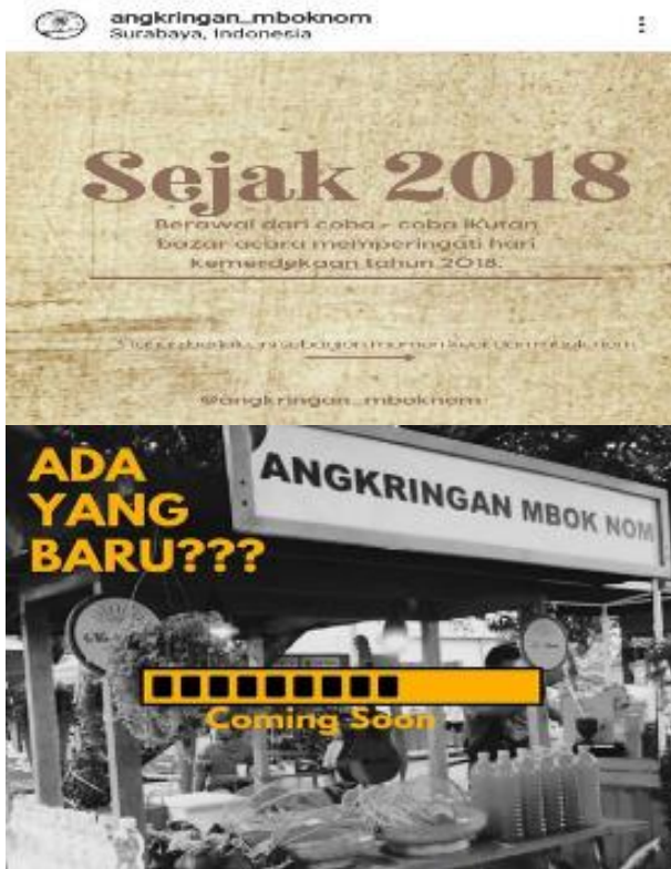
Gambar 1. Foto Mulai berdiri