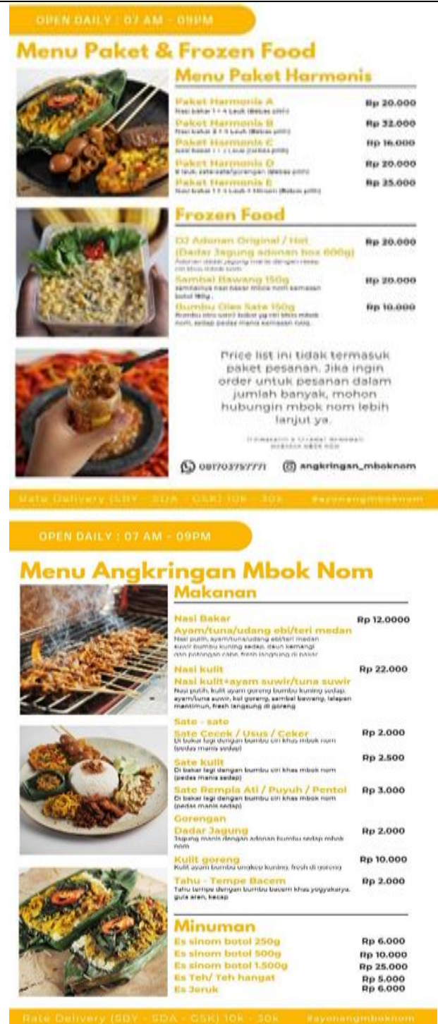
Gambar 11. Daftar Menu

Agar dapat lebih menarik minat konsumen untuk melakukan pembelian di angkringan Mbok Nom, dibuat daftar menu dan konten promosi penawaran yang sederhana dan menarik untuk ditawarkan melalui media sosial.