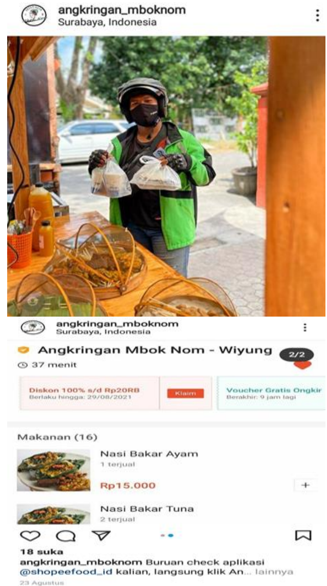
Gambar 9. Pemesanan melalui Gofood, Grabfood, Shopee

GoFood dan ShopeeFood, karena Angkringan Mbok Nom juga menjalin kerja sama dengan GoFood dan ShopeeFood dalam memasarkan produknya lebih luas lagi, sehingga dapat meningkatkan omset penjualan. Terutama dalam masa PPKM karena adanya Pandemi Covid-19 saat ini yang mengharuskan pengusaha makanan dan minuman untuk take away agar dapat meminimalisir kemungkinan penularan virus Covid-19