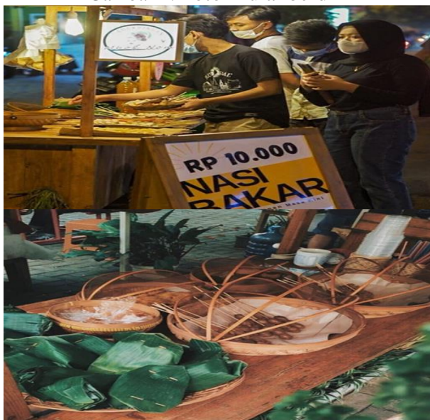
Gambar 2. Pemasaran yang Masih Sederhana