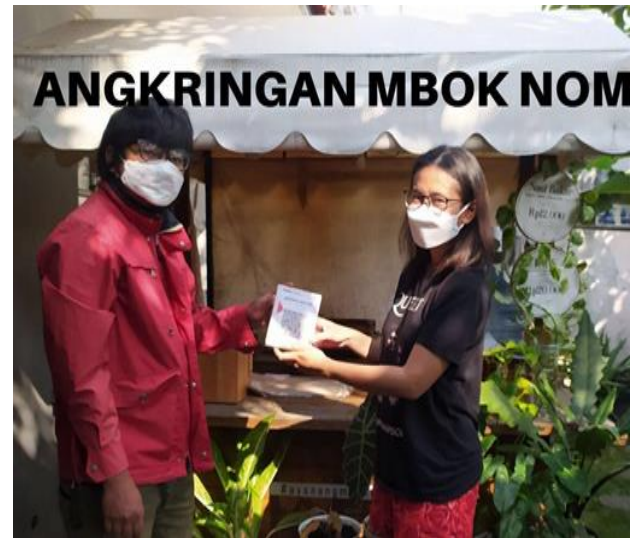
Gambar 13. Foto Sosialisasi CHRIS

Untuk kemudahan pembayaran di Angkringan Mbok Nom ditambahkan dengan pembayaran melalui CHRIS. Untuk kelancaran prosesnya terlebih dahulu dilakukan sosialisasi CHRIS sebagai alat pembayaran melalui barkode bila pembeli tidak membawa uang tunai.