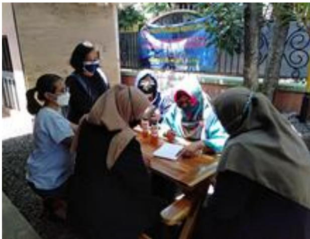
Gambar 14. Foto pelatihan