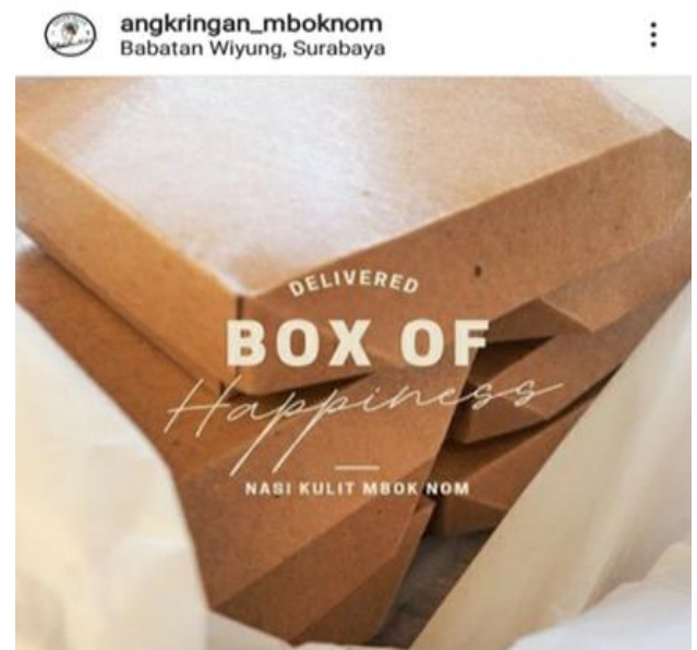
Gambar 7. Nasi kulit Mbok Nom

Pada proses pembuatan makanan di Angkringan Mbok Nom yang mayoritas pembuatannya dengan cara dipanggang, tentunya