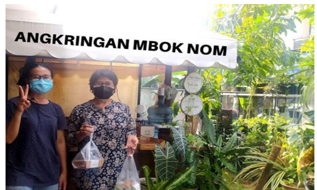
Gambar 4. Pembeli dari Berbagai Kalangan