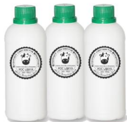
Gambar 15. Kemasan POC