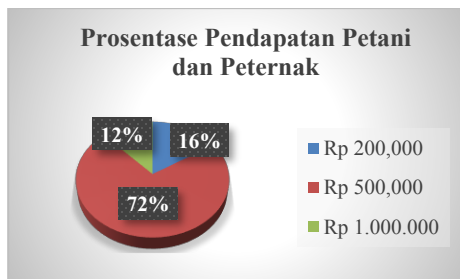
Gambar 2. Pendapatan Peternak dan Petani

Berdasarkan tabel 1 menunjukkan prosentase yang didapatkan 20% (908 orang) menjadi karyawan swasta, 12% (550 orang) petani, 11% (490 orang) pedagang, 7% (340 orang) buruh tani, 4% (165 orang) pertukangan, dan 46% (2.138 orang) lain- lain.