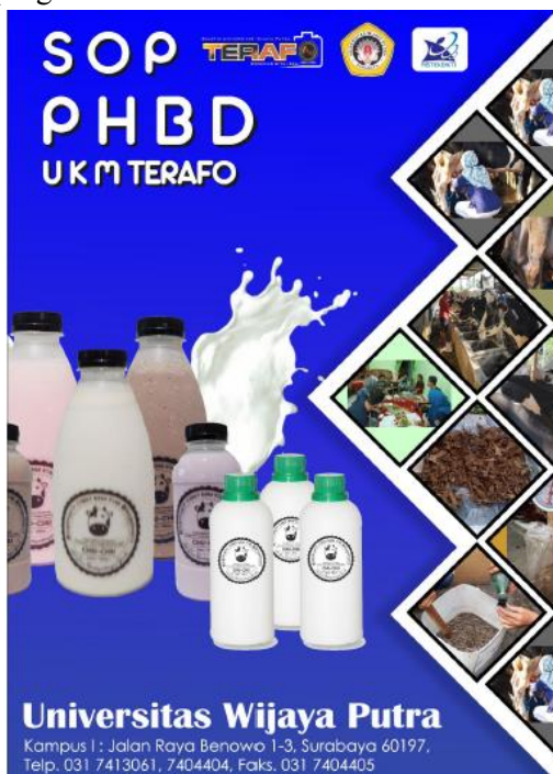
Gambar 6. Modul Penunjang Program

Modul yang dibuat berisi tentang pengenalan konsep pemberdayaan yang akan dilaksanakan, metode pemanfaatan kotoran sapi menjadi pupuk organik cair, metode pemanfaatan limbah organik rumah tangga dan limbah pertanian menjadi kompos,