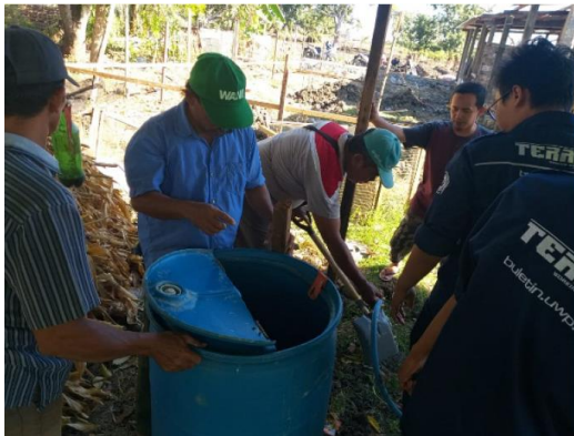
Gambar 11. Pelatihan dan Pendampingan pengolahan limbah

2) Kedua, tahap pengkapasitasan. Masyarakat diberikan kapasitas atau kemampuan dan ketrampilan yaitu dengan Pelatihannya dalam pengolahan limbah kotoran dan sampah organik menjadi POC (pupuk organik cair) dan pupuk kompos.