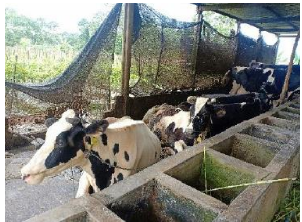
Gambar 8. Kondisi Kandang sapi dan keadaan sekitar yang akan digunakan

Pemilihan lokasi pusat pengolahan sampah di Desa Randupadangan dilakukan pada tahap awal sebelum pelaksanaan program. Pemilihan lokasi dipilih tempat yang strategis, mudah dijangkau oleh masyarakat dan tidak terletak jauh dari kandang sapi. Dimana lokasi yang dipilih sebagai tempat pengolahan limbah terpusat adalah lahan dibelakang kandang sapi milik Bapak Sulaiaman yang terletak di RT 018 RW 006 dengan ukuran lahan 6m x 10m. Pemilihan tersebut berdasarkan