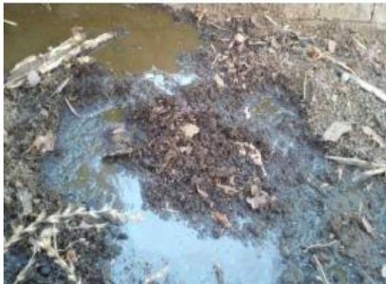
Gambar 4. Kotoran sapi yang dibuang sembarangan

desa menjadi kurang bersih. Hal tersebut ditegaskan bahwa penumpukan sampah dalam jangka panjang akan berakibat pada persoalan bau dan pencemaran air (Buhani, 2018; Mutaqin, 2010; Widiyanto, Yuniarno, & Kuswanto, 2015).