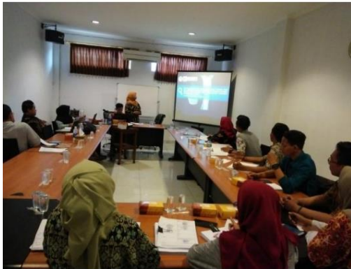
Tabel 2. Hasil monitoring dan evaluasi

Gambar 18. Monitoring dan Evaluasi Beberapa kendala yang ditemukan pada saat monitoring dan solusi penyelesaian yang diberikan dapat dilihat pada tabel 2 dibawah ini.