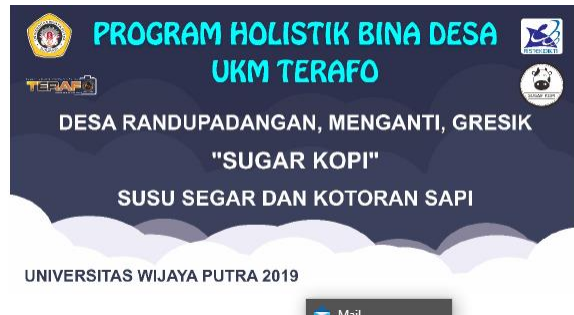
Gambar 9. Program PHBD 2019

Program ini merupakan program pemberdayaan yang dilakukan oleh Tim Hibah Bina Desa UKM Terafo (Terbitan Info) Universitas Wijaya Putra Tahun 2019 yang mendapatkan hibah dari Kementerian Riset, Teknologi dan Pendidikan Tinggi. Dimana program yang diusung oleh tim merupakan upaya untuk mendukung gerakan pembangunan Desa Semesta Nasional yaitu salah satu program pemerintah dalam mewujudkan desa mandiri berbasis masyarakat dan sumber daya alam lokal.