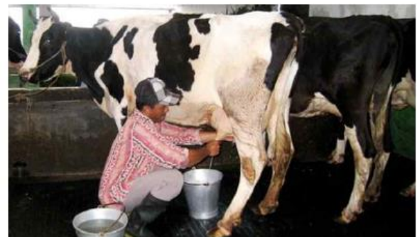
Gambar 3. Peternakan Gapoktan Padangan

Berdasarkan Komoditi pertanian utama didesa ini adalah padi dan jagung. Selain itu didesa ini terdapat kelompok tani aktif (gapoktan padangan) yang mengelola peternakan sebanyak 9 ekor sapi perah. Seluruh sapi dipelihara dalam kandang dengan kondisi semi permanen, sehingga kotoran sapi kurang lebih 135kg setiap harinya harus dibersihkan agar kandang selalu dalam keadaan bersih.