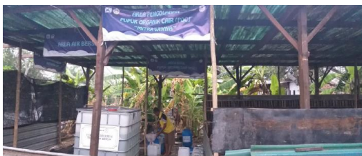
Gambar 14. Instalasi Pengolahan Limbah Terpusat