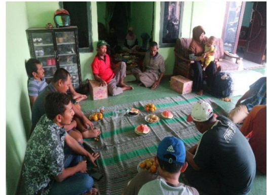
Gambar 12. Konsolidasi Tim dengan Mitra

3) Ketiga, tahap pendayaan. Tahap ini memberikan kekuasaan kepada anggota gapoktan padangan untuk menerapkan program berkelanjutan, masyarakat diberikan kepercayaan untuk mengelola sumber daya yang dimiliki serta kemampuan dan ketrampilan yang telah diberikan.