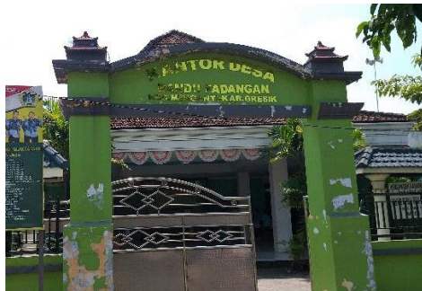
Gambar 1. Plakat Desa Randupadangan

Menurut Catatan Sipil Desa, Desa Randupadangan merupakan salah satu desa yang terletak di Kecamatan Menganti Kabupaten Gresik, memiliki luas wilayah 378.0 Ha dengan jumlah penduduk 4.586 jiwa yang terbagi menjadi dua dusun, Dusun Randu terdiri dari 2 RT dan 1 RW dengan jumlah keseluruhan 1.215 kepala keluargasedangkan Dusun Padangan terdiri dari 20 RT dan 6 RW 3.371 kepala keluarga.