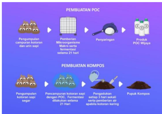
Gambar 12. Skema Pembuatan POC dan Kompos

Kegiatan pengolahan limbah menjadi POC dan pupuk kompos dilaksanakan secara bertahap yaitu pada tanggal 18 Agustus 2019 dan pendampingan yang ke 2 pada tanggal 29 September 2019 di kandang sapi milik Gapoktan Padangan yang terletak tidak jauh dari rumah Bapak Sulaiman.