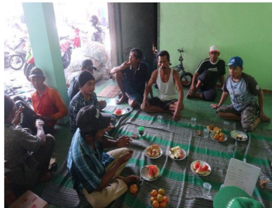
Gambar 10. Sosialisasi dengan Gapoktan Padangan

1) Pertama, tahap penyadaran. Tahap ini Gapoktan Padangan diberikan penyadaran melalui sosialisasi secara lisan yang dilakukan oleh tim. Penyadaran dilakukan dengan tujuan merubah mindset masyarakat tentang dampak dan manfaat kotoran sapi dan sampah organik. Sehingga, Gapoktan Padangan merubah perilakunya dengan menggunakan pupuk organik untuk lahan pertaniannya.