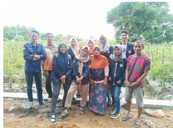
Gambar 5. Tim dan Pengurus Gapoktan Padangan

Program ini dilaksanakan di Desa Randupadangan Kecamatan Menganti Kabu Paten gresik dengan mitra sasaran Gapoktan Padangan. Waktu pelaksanaan pengabdian ini yaitu selama 6 bulan yakni mulai tahap persiapan hingga pelaporan.