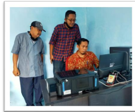
Gambar 3 Pelatihan pengoperasian Aplikasi SiPamsimas kepada pengurus BUMDes

Dalam penggunaan aplikasi SiPamsimas telah dilakukan pelatihan dan pendampingan beberapa kali, baik dengan pengurus BUMDes ataupun kepada petugas pencatat meter, hal tersebut sangat di sambut baik oleh pengurus BUMDes dikarenakan kemudahan dalam pengoperasian dan mempermudah dalam mencetak slip tagihan.