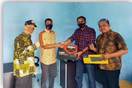
Gambar 4 serah terima perabot kantor

3) pengadaan komputer dan perabot kantor dilaksanakan serah terima kepada pengurus BUMDes dan kepala Desa Cagak agung