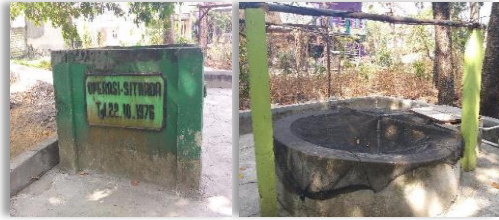
Gambar 1 Sumur Kidul sebagai bahan baku PAMSIMAS

Pada tahun 2017, melalui program Penyediaan Air Minum dan Sanitasi bagi Masyarakat (PAMSIMAS) dari Pemerintah Kabupaten Gresik dan didukung dengan Dana Desa, dibuatkan tandon baru dengan kapasitas 6000 liter dan pemasangan instalasi pipa induk dan sambungan rumah (SR) secara bertahap. Saat ini PAMSIMAS sudah mampu mengaliri 488 sambungan rumah di 2 Dusun yaitu Dusun Cagak dan Dusun Agung