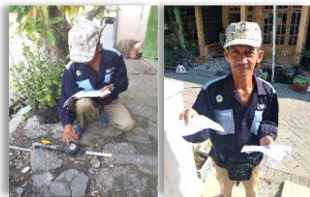
Gambar 1 Petugas Pencatat Meter dan Penyerahan Slip Tagihan Air

Struktur organisasi BUMDes hanya terdiri dari Ketua, Sekretaris dan Bendahara. Pengurus yang saat ini ada 3 orang yaitu Ketua, Sekretaris dan Bendahara, dibantu dengan 11 petugas lapangan yang merupakan Ketua RT sebagai pencatat meter, penagihan, pengawas dan pemeliharaan. Sistem pengupahan Pengurus juga masih sangat sederhana, besaran upah ditentukan 10% dari pembayaran yang diterima dari masing-masing RT.