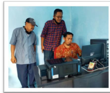
Gambar 3 Pelatihan pengoperasian Aplikasi SiPamsimas kepada pengurus BUMDes

Dalam penggunaan aplikasi SiPamsimas telah dilakukan pelatihan dan pendampingan beberapa kali, baik dengan pengurus BUMDes ataupun kepada petugas pencatat meter, hal tersebut sangat di sambut baik oleh pengurus BUMDes dikarenakan kemudahan dalam pengoperasian dan mempermudah dalam mencetak slip tagihan.