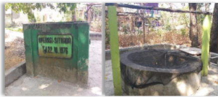
Gambar 1 Sumur Kidul sebagai bahan baku PAMSIMAS

Pada tahun 2017, melalui program Penyediaan Air Minum dan Sanitasi bagi Masyarakat (PAMSIMAS) dari Pemerintah Kabupaten Gresik dan didukung dengan Dana Desa, dibuatkan tandon baru dengan kapasitas 6000 liter dan pemasangan instalasi pipa induk dan sambungan rumah (SR) secara bertahap. Saat ini PAMSIMAS sudah mampu mengaliri 488 sambungan rumah di 2 Dusun yaitu Dusun Cagak dan Dusun Agung