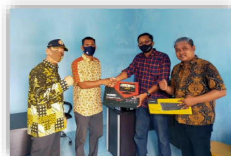
Gambar 4 serah terima perabot kantor

3) pengadaan komputer dan perabot kantor dilaksanakan serah terima kepada pengurus BUMDes dan kepala Desa Cagak agung