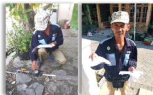
Gambar 1 Petugas Pencatat Meter dan Penyerahan Slip Tagihan Air

Struktur organisasi BUMDes hanya terdiri dari Ketua, Sekretaris dan Bendahara. Pengurus yang saat ini ada 3 orang yaitu Ketua, Sekretaris dan Bendahara, dibantu dengan 11 petugas lapangan yang merupakan Ketua RT sebagai pencatat meter, penagihan, pengawas dan pemeliharaan. Sistem pengupahan Pengurus juga masih sangat sederhana, besaran upah ditentukan 10% dari pembayaran yang diterima dari masing-masing RT.