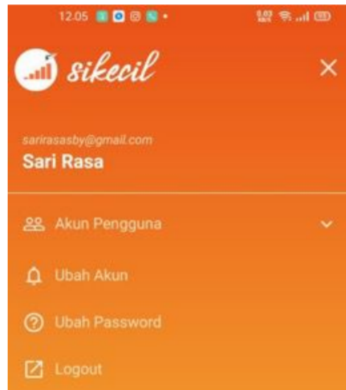
Gambar 6. Aplikasi pencatatan keuangan Daring