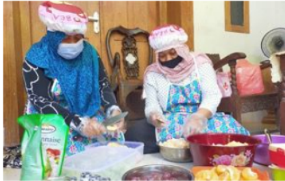
Gambar 2. Kegiatan Produksi Salad Buah

Dengan menerapkan protokol kesehatan dan komunikasi daring pada kegiatan pendampingan dan pelatihan dimulai bulan Juli sampai September 2020. Partisipasi mitra dalam program sangatlah aktif sehingga kegiatan Pengabdian dapat berjalan sesuai yang diharapkan, seluruh anggota kelompok mitra merupakan Ibu rumah tangga yang rumahnya berdekatan, kegiatan produksi salad buah dilakukan pada siang hari Ketika sudah menyelesaikan aktivitas rutin rumah tiap pagi hari. Salad buah merupakan produk olahan makanan yang menyehatkan dan dari hasil peningkatan penjualan salad buah tersebut diharapkan dapat meningkatkan perekonomian rumah tangga dan membuka lowongan pekerjaan apabila produksi salad buah tersebut meningkat. Proses kegiatan produksi dan pengemasan dapat dilihat pada gambar 2, 3, dan 4.