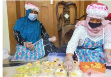
Gambar 3. Kegiatan Pengemasan Salad Buah