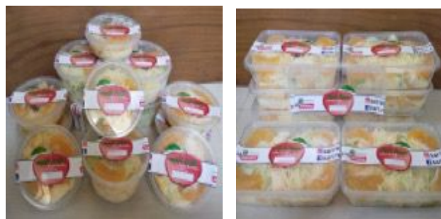
Gambar 4. Produk Salad Buah Dalam Kemasan

Setelah melakukan pendampingan dan pelatihan kegiatan produksi serta pengemasan, team PKM UWP melakukan pendampingan dan pelatihan dalam pengelolaan pemasaran menggunakan eCommerce, WhatsApp Business, Facebook, dan Instagram. Penjualan dan pemasaran produk melalui dunia maya mempunyai banyak keuntungan, yaitu cakupan yang luas, tidak mengenal ruang dan waktu, dapat dilakukan kapan saja dan dimana saja (Jauhari, J. 2010). Serta pendampingan dan pelatihan penggunaan aplikasi pencatatan keuangan daring agar proses keuangan harian tercatat dengan baik. Kegiatan tersebut terlihat pada gambar 5, 6, dan 7.