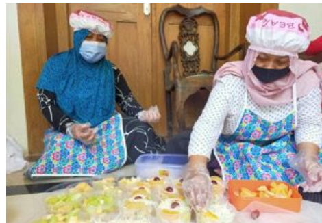
Gambar 3. Kegiatan Pengemasan Salad Buah