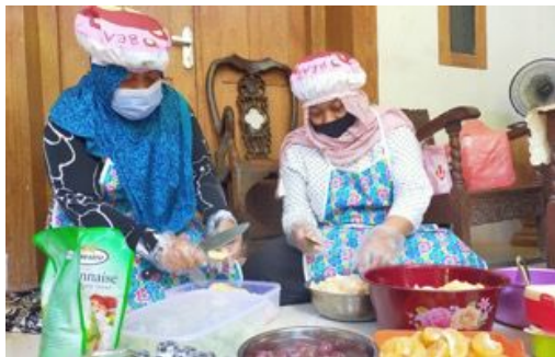
Gambar 2. Kegiatan Produksi Salad Buah

Dengan menerapkan protokol kesehatan dan komunikasi daring pada kegiatan pendampingan dan pelatihan dimulai bulan Juli sampai September 2020. Partisipasi mitra dalam program sangatlah aktif sehingga kegiatan Pengabdian dapat berjalan sesuai yang diharapkan, seluruh anggota kelompok mitra merupakan Ibu rumah tangga yang rumahnya berdekatan, kegiatan produksi salad buah dilakukan pada siang hari Ketika sudah menyelesaikan aktivitas rutin rumah tiap pagi hari. Salad buah merupakan produk olahan makanan yang menyehatkan dan dari hasil peningkatan penjualan salad buah tersebut diharapkan dapat meningkatkan perekonomian rumah tangga dan membuka lowongan pekerjaan apabila produksi salad buah tersebut meningkat. Proses kegiatan produksi dan pengemasan dapat dilihat pada gambar 2, 3, dan 4.