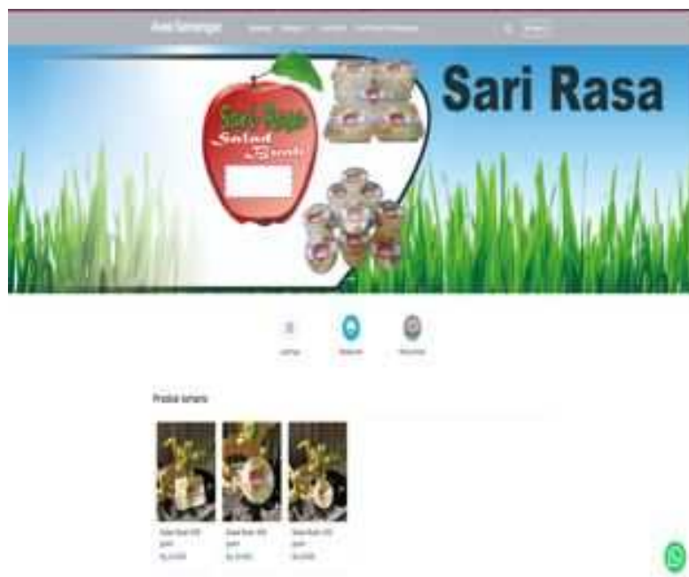
Gambar 7. Website eCommerce

Berdasarkan hasil kegiatan dalam pendampingan dan pelatihan penggunaan aplikasi digital daring dalam pencatatan keuangan dan pemasaran, maka diperoleh: 1) Terdapat peningkatan pemahaman pentingnya teknologi terhadap usaha; 2) Meningkatnya kemampuan dalam pengelolaan teknologi internet; 3) Peningkatan dalam penyerapan pasar; 4) Peningkatan kemampuan komunikasi bagi mitra dalam mengelola website dan Social Media Marketing, yaitu kemampuan mitra mengkomunikasikan produk dan merk produk sehingga memiliki daftar pelanggan tetap pada website yang berpotensi melakukan pembelian produk secara berkelanjutan yang sudah dipublikasikan pada jurnal abmas (Harto, Pratiwi, Utomo, & Rahmawati, 2019).