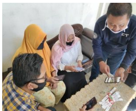
Gambar 5. Pelatihan Aplikasi Pencatatan Keuangan dan eCommerce

Setelah melakukan pendampingan dan pelatihan kegiatan produksi serta pengemasan, team PKM UWP melakukan pendampingan dan pelatihan dalam pengelolaan pemasaran menggunakan eCommerce, WhatsApp Business, Facebook, dan Instagram. Penjualan dan pemasaran produk melalui dunia maya mempunyai banyak keuntungan, yaitu cakupan yang luas, tidak mengenal ruang dan waktu, dapat dilakukan kapan saja dan dimana saja (Jauhari, J. 2010). Serta pendampingan dan pelatihan penggunaan aplikasi pencatatan keuangan daring agar proses keuangan harian tercatat dengan baik. Kegiatan tersebut terlihat pada gambar 5, 6, dan 7.