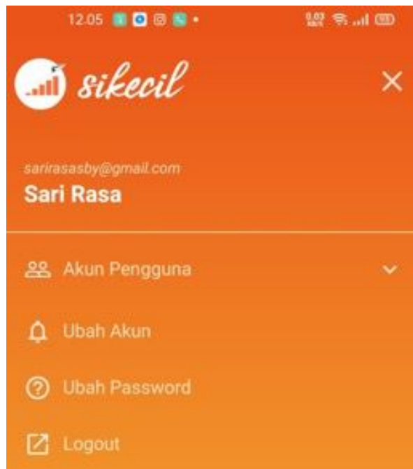
Gambar 6. Aplikasi pencatatan keuangan Daring