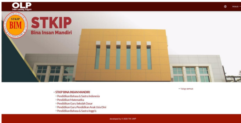
Gambar 1. Tampilan Depan Media Pembelajaran Daring

Saat pelaksanaan pembelajaran secara daring sangat memerlukan media pembelajaran yang tepat untuk menunjang keberhasilan proses pembelajaran. Selain itu interaksi dosen dengan mahasiswa, dan evaluasi pembelajaran juga menunjang proses pembelajaran daring. Selain itu mahasiswa cukup antusias dalam belajar ketika menggunakan media pembelajaran daring dengan aplikasi moodle. Dalam penelitian yang terlaksana ini untuk perlakuan yang dilakukan terhadap dosen dan mahasiswa berupa penggunaan media pembelajaran daring berupa aplikasi moodle. Untuk tampilan awal media pembelajaran daring menggunakan aplikasi moodle yang sudah dikembangkan dapat dipaparkan pada gambar berikut ini: