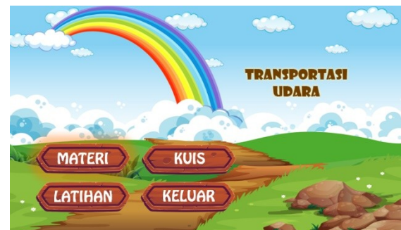
Gambar 1. Contoh materi ajar animasi yang dibuat oleh tim

Koordinasi awal dilaksanakan selama 2 kali pertemuan untuk menentukan tempat dan waktu yang tepat bagi peserta. Pembuatan modul dilaksanakan oleh tim pengusul sebagai bahan referensi guru ketika praktik mandiri. Kegiatan pelatihan diikuti oleh xx orang guru dari berbagai TK di sekitar wilayah Gayungan Surabaya. Kegiatan pelatihan diawali dengan menunjukkan beberapa materi ajar animasi yang telah dibuat oleh tim pengusul. Selanjutnya dijelaskan tentang panjabaran bagaimana animasi bisa memuat materi ajar dalam bentuk audio visual yang bisa menarik minat siswa, terutama usia TK. Hal ini dikarenakan, sebagian besar materi ajar yang diberikan oleh guru berupa buku teks sehingga kurang bervariasi. Pengenalan materi ajar animasi berguna untuk membuka wawasan dan memicu semangat guru untuk membuat materi ajar yang menarik.