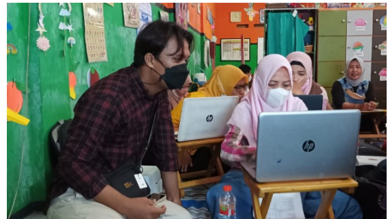
Gambar 4. Pendampingan langsung kepada peserta