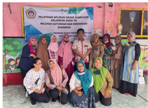
Gambar 5. Para peserta dan pemateri

Pada bagian akhir pelatihan, kami memberikan post-test pada para peserta. Hasil dari pengukuran tersebut, pemahaman guru meningkat setelah diadakan pelatihan. Guru memahami bagaimana membuat materi ajar animasi dengan Ms Power Point. Peningkatan pemahaman guru dapat dilihat pada Gambar 6.