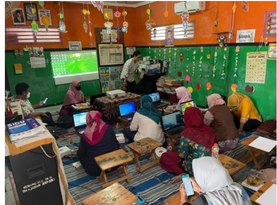
Gambar 3. Pelaksanaan Pelatihan

menyiapkan bahan-bahan seperti gambar background, objek, dan bacsound yang akan ditampilkan di layar. Tim pelaksana telah menyiapkan semua bahan yang diperlukan untuk membuat materi ajar, sehingga peserta dapat langsung mempraktekkan.