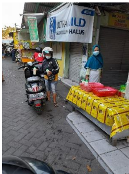
Gambar 3. Penjualan Saridele di pasar

Sebelum mendapatkan pendampingan, mitra Saridele menjual produknya di pinggir jalan dan bahkan mitra harus masuk dari kampung ke kampung menggunakan motor. Menawarkan dagangannya dari pintu ke pintu. Mitra harus merasakan teriknya matahari dan bahkan harus berbasah-basahan di musim hujan.