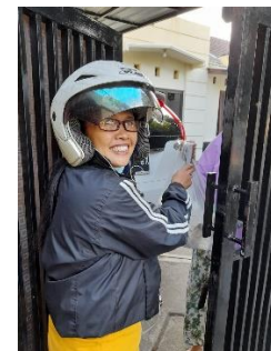
Gambar 5. Mitra mengantarkan pesanan Saridele kepada pelanggan yang memesan secara online

Setelah mendapatkan pendampingan dari pengabdian, dengan adanya diversifikasi produk Saridele mengalami peningkatan dalam penjualan varian rasa coklat dan stroberi. Tetapi secara keseluruhan penjualan Saridele mengalami penurunan.