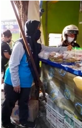
Gambar 6. Menata produk Saridele di lapak

Pengabdian juga mendaftarkan produk saridele ini pada platform gofood dan grabfood .