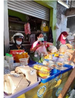
Gambar 4. Penjualan Saridele di lapak

Tetapi setelah pandemi dan sekolah ditutup mitra hanya mengandalkan penjualan dengan cara titip jual di pasar.