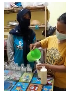
Gambar 1. Pengemasan Saridele dengan menggunakan botol

Pengabdian memberikan pendampingan kepada mitra dalam memproduksi saridele dalam hal pengemasan produk dimana pengemasannya menggunakan botol plastik dari yang sebelumnya menggunakan gelas plastik. Pengemasan dengan menggunakan botol plastik terlihat lebih higienis dan bisa membuat produksi lebih tahan lama. Meskipun memang harga jual menjadi lebih mahal tetapi pelanggan tidak melihat harga yang harus mereka bayar karena produk yang ditawarkan adalah produk yang menggunakan bahan-bahan yang berkualitas dan bukan bahan-bahan sintesis