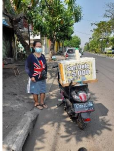
Gambar 2. Penjualan saridele di pinggir jalan

atau kimia serta pengemasan yang juga higienis.