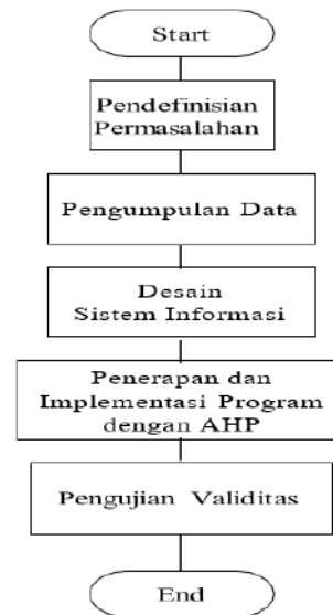
Gambar 2. Langkah-Langkah Penelitian