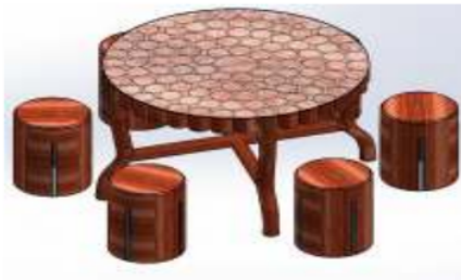
Gambar 1. Hasil Perancangan Kursi Meja Hias Taman

sedikit dan ini dimiliki oleh kayu mahoni. Berbeda dengan kayu jati yang memiliki serat bagus, serat kayu mahoni cenderung polos. Dulu, ini dianggap sebagai kekurangan. Kini, banyak industri yang menganggap minimnya serat ditambah minimnya mata kayu sebagai sebuah kelebihan dari mahoni. Kondisi ini membuat kayu tampil lebih ringan dan tidak terkesan berat. Baik menggunakan finishing maupun tidak di-finishing, tidak masalah. Bahkan, kayu ini dinilai sangat fleksibel dan cocok untuk membuat furnitur berbagai gaya tanpa adanya batasan. Berikut gambar desain furniture yang sudah dirancang :