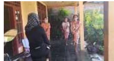
Gambar 9. Gerakan Senam Lansia

Tim pengabdian melakukan senam lansia bersama dengan peserta. Memberikan contoh senam lansia yang mudah diingat oleh para peserta dan bisa dilakukan secara mandiri dimana saja.