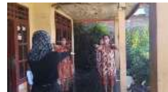
Gambar 8. Gerakan Senam Lansia

Ada yang mengikuti senam ada yang mengikuti penjelasan tim pengabdian melalui pamflet yang telah dibagikan di awal kegiatan ini. Jadi para lansia secara bergantian mengikuti kegiatan ini.