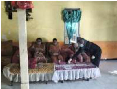
Gambar 6. Pemeriksaan Kadar Oksigen pada Kelompok Lansia

Tim pengabdian memberikan penjelasan kepada para lansia bahwa tensi darah juga harus diperhatikan jangan sampai tensi darah mereka melewati ambang batas normal yang bisa menimbulkan stroke dan dapat memicu terjadinya Demensia/Alzheimer .