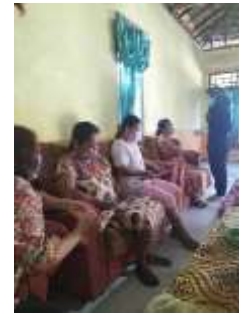
Gambar 4. Pemeriksaan Kesehatan Sebelum Kegiatan Dimulai

Maka dari itu tim pengabdian berusaha memberikan informasi yang selengkap-lengkapnyanya mengenai penyakit Demensia/Alzheimer ini dengan membagikan pamflet dan mengedukasi para lansia mengenai penyakit ini. Pemahaman mereka mengenai apa dan bagaimana penyakit ini menjadi lebih baik dari sebelumnya.