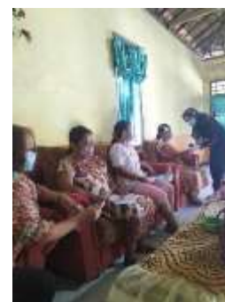
Gambar 5. Pemeriksaan Tensi Darah Pada Kelompok Lansia

Pertama-tama yang dilakukan oleh tim pengabdian adalah mendata terlebih dahulu para lansia yang hadir dalam pelaksanaan kegiatan ini. Data yang diperlukan adalah nama, alamat, nomor telepon dan keluhan yang dirasakan. Setelah data didapatkan barulah beranjak ke proses berikutnya.