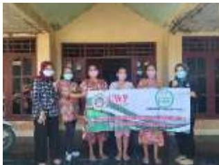
Gambar 3. Pelaksanaan Kegiatan

Kegiatan ini dilaksanakan di Desa Prigen, Kecamatan Prigen, Kabupaten Pasuruan. Salah satu alasan tim pengabdian melakukan kegiatan pengabdian kepada masyarakat ini adalah karena informasi mengenai bahaya penyakit Demensia/Alzheimer ini dirasa masih kurang.