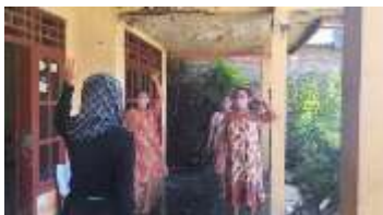
Gambar 7. Gerakan Senam Lansia

Dari hasil pemeriksaan kesehatan ini dapat disimpulkan bahwa kesehatan para lansia peserta kegiatan pengabdian kepada masyarakat ini dalam kondisi baik. Tidak ada keluhan yang berarti selain keluhan yang lazim terjadi pada lansia.