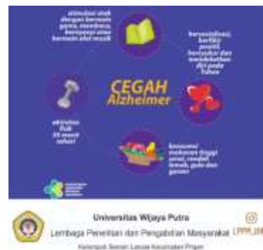
Gambar 2. Cara-Cara Pencegahan Demensia/Alzheimer

Gejala umum yang biasanya terjadi pada penderita Demensia/Alzheimer dimana gejala tersebut biasanya adalah sering hilang ingatan, sulit melakukan kegiatan harian, sering bingung, sulit menentukan kata dan angka serta sering berubah suasana hati dan perilaku.