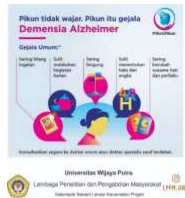
Gambar 1. Gejala Umum Pada Penderita Demensia/Alzheimer

Adapun pamflet yang dibagikan kepada para lansia ada 2 macam. Pamflet pertama berisi gejala umum pada penderita Demensia/Alzheimer dan pamflet kedua berisi cara-cara pencegahan Demensia/Alzheimer .