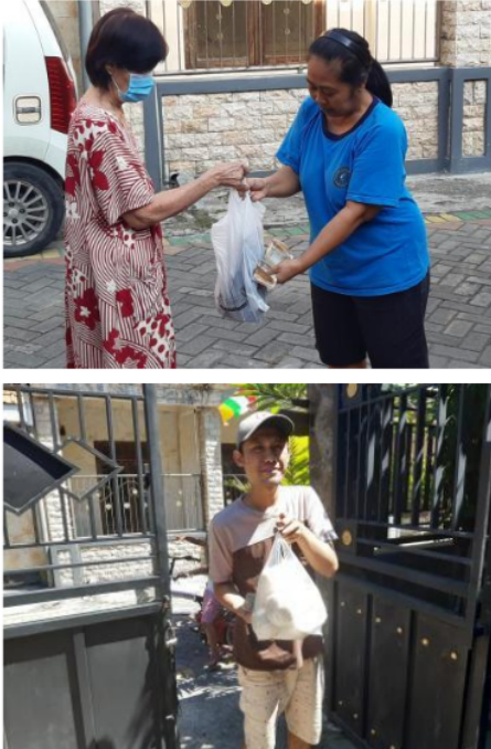
Gambar 3. Transaksi Antar Penjual dan Pembeli

Sisi lain dari adanya kegiatan Belanja Antar Tetangga adalah meningkatnya intensitas bersosialisasi antar warga. Karena barang diantar ke rumah pemesan oleh penjual. Mereka bisa saling menyapa. Dari kegiatan Belanja Antar Tetangga dapat meringankan warga yang kesulitan ekonomi dengan menambah pendapatan rumah tangga antara Rp. 200.000 sampai dengan Rp. 500.000 per bulan. Jadi dengan kegiatan ini telah muncul jiwa wirausaha bagi ibu-ibu PKK Kelurahan Lontar Kota Surabaya. Mereka mampu menangkap peluang yang ada di depan mereka.