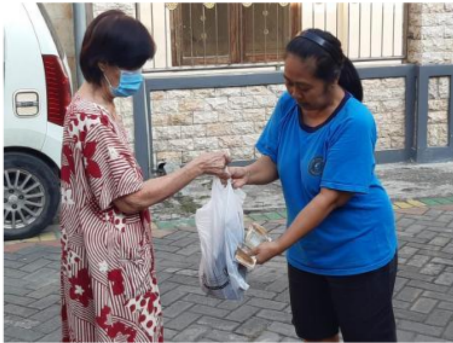
Gambar 3. Transaksi Antar Penjual dan Pembeli

Berikut adalah transaksi yang terjadi antara penjual dengan pembeli yang kesemuanya dilakukan di lingkungan Kelurahan Lontar Kota Surabaya. Pembayaran dilakukan secara tunai karena jumlahnya tidak banyak dan lokasinya tidak jauh. Sehingga baik penjual maupun pembeli sama-sama diuntungkan dan sama-sama dimudahkan. Pembeli tidak perlu keluar rumah, karena mereka memesan barang lewat media WhatsApp dan barang diantar ke rumah pembeli. Sementara penjual memperoleh keuntungan dari barang yang dijualnya.