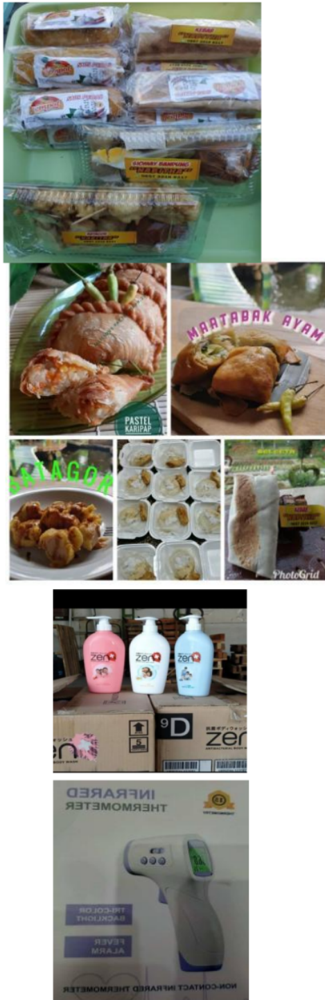
Gambar 2. Barang-Barang yang Ditawarkan melalui WhatsApp pada Kegiatan Belanja Antar Tetangga

Berikut adalah transaksi yang terjadi antara penjual dengan pembeli yang kesemuanya dilakukan di lingkungan Kelurahan Lontar Kota Surabaya. Pembayaran dilakukan secara tunai karena jumlahnya tidak banyak dan lokasinya tidak jauh. Sehingga baik penjual maupun pembeli sama-sama diuntungkan dan sama-sama dimudahkan. Pembeli tidak perlu keluar rumah, karena mereka memesan barang lewat media WhatsApp dan barang diantar ke rumah pembeli. Sementara penjual memperoleh keuntungan dari barang yang dijualnya.