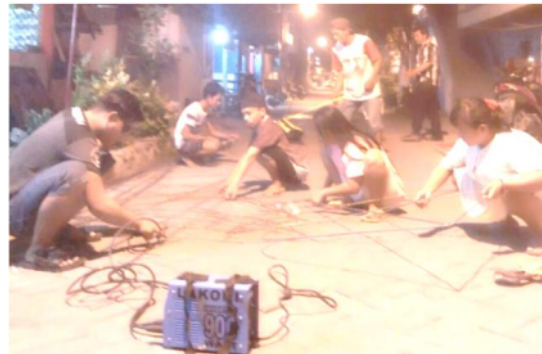
Gambar 5.3 praktek pembuatan layang-layang hias Sampai dengan saat ini, proses praktek masih berlangsung dengan pengerjaan layang-layang hias.

Berikutnya, peserta mempraktekkan las di kampungnya dengan membuat layang-layang hias. Layang-layang hias ini selain untuk praktek juga digunakan untuk menghias kampung dengan tambahan bantuan dana dari Bapak Camat Benowo. Untuk awal praktek mereka membuat 15 unit layang-layang, yang akan ditempatkan di beberapa tempat di RW. 09 Kelurahan Kandangan.