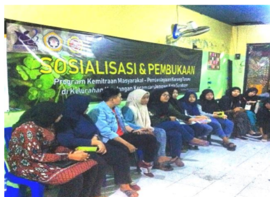
Gambar 5.1 Sosialisasi Program

Kegiatan ini dilaksanakan di Balai RT. 02 RW. 09 Kelurahan Kandangan, dihadiri oleh 30 orang anggota Karang Taruna dan beberapa anggota PKK yang sangat ingin tahu kegiatan tim pelaksana. Dalam pertemuan ini, tim pelaksana menjelaskan tentang tujuan dan program yang akan dilaksanakan, serta menampung aspirasi dari anggota karang taruna.