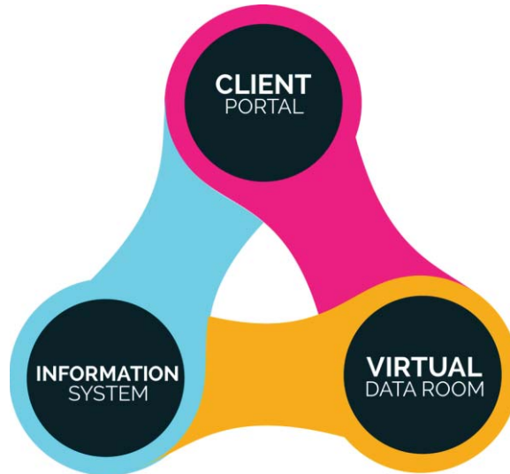
Gambar 3. Model Pengembangan Sistem Informasi Kantor Hukum.

Dari ketiga hal pokok untuk proses layanan jasa hukum virtual (gambar 3), penulis lebih cenderung menggunakan terminologi Client Portal , Information System dan Virtual Data Room sebagaimana tiga hal yang dikembangkan Virlo. (Budi Endarto : 2017)