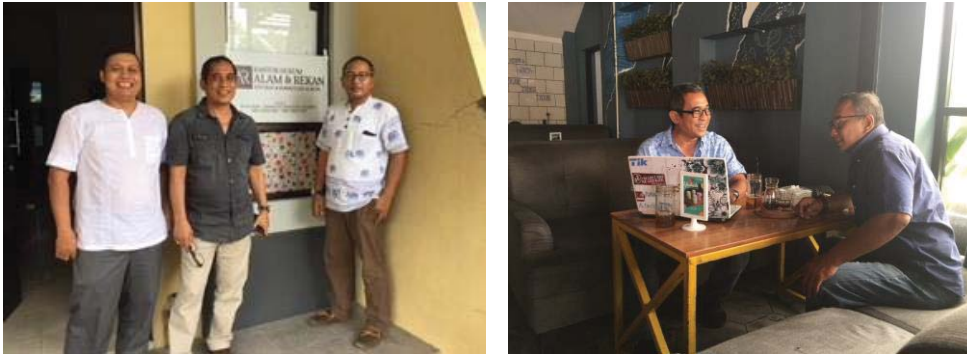
Gambar 5. Sosialisasi dan pelatihan penggunaan aplikasi Virlo pada Kantor Hukum Alam & Rekan