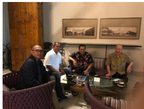
Gambar 3. Pendampingan Pelaksanaan Legal Due Diligence Dengan Klien Mitra

Sampai dengan akhir bulan Agustus 2020, kantor hukum mitra telah memberikan 2 (dua) bentuk layanan jasa hukum berupa legal due diligence terhadap transaksi pengambilalihan usaha yang dilakukan oleh kliennya. Kegiatan tersebut memberikan pengalaman pada kantor hukum mitra untuk menanggapi layanan jasa hukum non litigasi . Dengan demikian maka perencanaan untuk melakukan diversifikasi layanan jasa hukum telah dapat direalisasikan pada tahun pertama sejak pelatihan dan pendampingan diberikan.