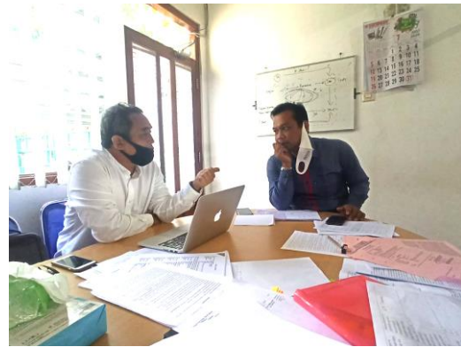
Gambar 1. Pelatihan Penyusunan Legal due Diligence

tujuan legal due diligence . Berikutnya materi pelatihan pemeriksaan terhadap perjanjian dengan pihak ketiga yang meliputi pihak dalam perjanjian, objek perjanjian, nilai perjanjian, hak dan kewajiban para pihak, pembatasan-pembatasan bagi para pihak sesuai dengan transaksi yang akan dilakukan, klausul pengakhiran, keadaan cidera janji, dampak perjanjian terhadap perusahaan.