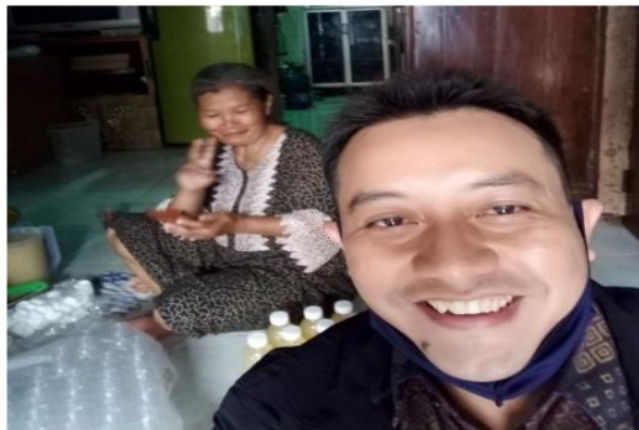
Gambar 3. Dokumentasi Peneliti dengan Mitra.

Berdasarkan hasil pelatihan kegiatan administrasi dan keuangan dapat di ketahui bahwa rata – rata produksi perbulan sebanyak 2 kali produksi atau penjualan per bulan sebesar Rp.1.300.000 dengan tingkat laba kotor sebesar 44% atau Rp. 572.000. Memang nilai produksi dan penjualan dapat dikatakan relatif masih kecil, namun setiap bulan trennya cenderung naik seiring mulai di kenalnya oleh masyarakat yang lebih luas. Berikut dokumentasi pelatihan dan pendampingan.