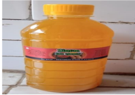
Gambar 2. Produk Ramuan Herbal dan Label.