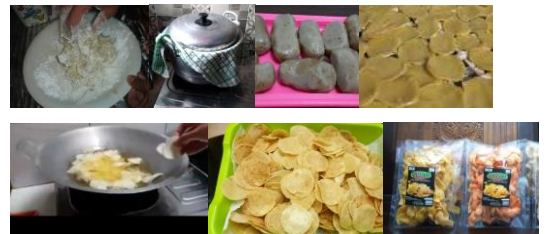
Gambar 6. Proses Pembuatan Keripik Okara

Cara pembuatan keripik okara yaitu Campurkan rata 500gr okara, 500gr tepung tapioka dan bumbu yang telah dihaluskan (60gr bawang putih, 15gr garam, 5gr gula, penyedap rasa secukupnya). Masukkan adonan ke dalam plastik dan bentuk persegi memanjang. Kukus adonan sampai matang (±2 jam). Dinginkan adonan dan disimpan sampai mengeras. Iris adonan tipis-tipis dan jamur sampai kering sehingga menjadi krecek. Goreng krecek keripik okara. Biarkan dingin (bisa ditambah dengan perasa pedas atau manis) dan simpan dalam wadah kedap udara