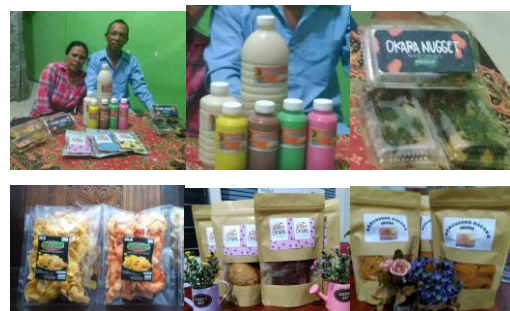
Gambar 7. Mitra “Putune Eyang” dan Produk