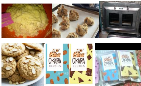
Gambar 4. Proses Pembuatan Kukis Okara beserta label dan kemasan

Cara pembuatan kukis okara yaitu dengan mengocok 60gr mentega atau roombutter, 1 butir kuning telur, 50gr gula halus, dan vanila dengan mixer hingga merata. Kemudian ditambahkan dengan 150gr terigu dan 50gr okara yang sudah disangrai. Uleni sampai kalis dan tambahkan topping chocochips atau almond. Ambil sebagian dan cetak diatas loyang, olesi dengan kuning telur. Panggang kue dalam oven dengan suhu 140°C selama ±20 menit hingga matang. Angkat dan diamkan hingga dingin, kemudian masukkan dalam wadah kedap udara