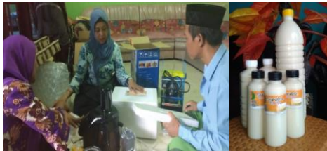
Gambar 1. Pelatihan Packaging

modern.(3)Pelatihan pemasaran offline sistem konsinyasi dibantu istri Bapak Hari yaitu Ibu Nur dan mengawal usaha pelebaran pangsa pasar dengan sistem konsinyasi ke koperasi, kantin, maupun cafe yang bisa dijangkau.(4)Pelatihan pemasaran secara online dimulai dari pemasaran melalui Whatsapp, Facebook, dan Media Pemasaran lainnya.