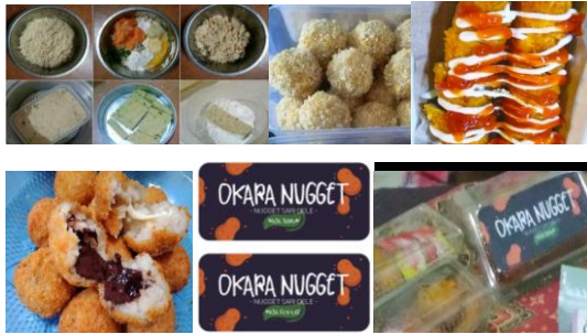
Gambar 3. Proses Pembuatan Nugget Okara beserta label dan kemasan

panir. Setelah itu nugget siap digoreng dan disajikan hangat. Namun jika tidak langsung digoreng, nugget bisa disimpan didalam freezer (frozen)